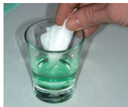
Stosowanie płynu do płukania ust